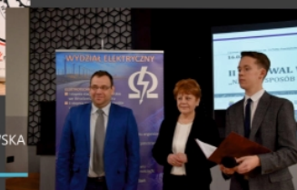
POLITECHNIKA WROCŁAWSKA WYDZIAŁ ELEKTRYCZNY

Klasa jest ofertą dla przyszłych inżynierów, informatyków, naukowców, menadżerów, matematyków, fizyków.