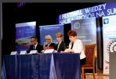
PODPISANIE POROZUMIENIA O WSPÓŁPRACY I LO Z POLITECHNIKA ŚLĄSKĄ, UNIWERSYTEM ŚLĄSKIM, UNIWERSYTEM OPOLSKIM.