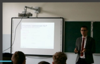
WSPÓŁPRACA I LO Z WYDZIAŁEM KOMUNIKACJI I INFORMATYKI UNIwersytetu Ekonomicznego W KATOWICACH

Klasa utworzona z myślą o przyszłych ekonomistach, geologach, pracownikach administracji i sektora turystycznego, itp.