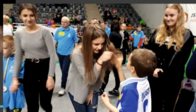
POMOC WOLONTARIUSZY JEDYNKI W OLIMPIADZIE SPECJALNEJ - JASTRZĘBIE ZDRÓJ 2019

Klasa utworzona z myślą o przyszłych pedagogach, psychologach, terapeutach, ratownikach, pracownikach socjalnych, itp.